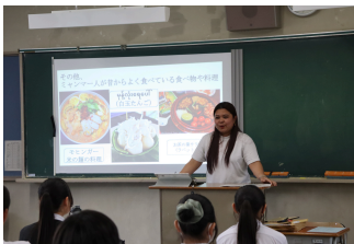
2)名古屋経済大学*留学生の方々