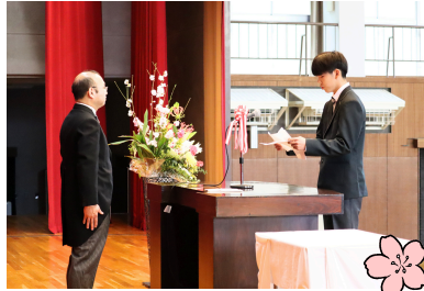
新入生代表 入学式挨拶