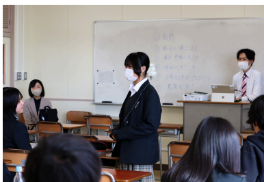
オリエンテーション&自己紹介

3年生の「地域探究Ⅱ」では、1・2年次の探究授業を通して学んできたこと踏まえ、「さらに深めたい」という思いをもった生徒たちが集結！自分だけの探究へと向かう準備がまりました。