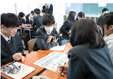
【ライフラインチャート】 人生のどんな経験が今の私を作っているのか振り返る