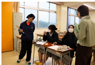
ライフラインチャート深掘り