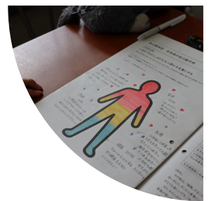
【私の成分表】 私はどんな人なのか？ 要素で自分の見つけ直し