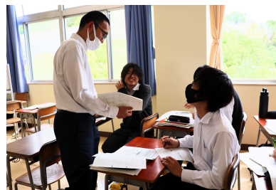
好きなものリスト100作成

自己紹介や好きなものビンゴを通して、新しいクラスのメンバーに慣れるところから活動を始めました。また、これまでの自分史を振り返るライフラインチャートを作成し、印象に残っている出来事や、そのときの感情について深く考えました。さらに、価値観リストや「好きなものリスト100」を作成し、仲間や先生との対話を通して、自分自身の考えや大切にしていることを言葉にしていきました。自分と友達とは、感じ方や大切にしていることが異なることにも気づくことができたでしょう。これから、この「自分の好き」から芽生えた感覚が、自分だけの探究プロジェクトを実行していくための“種”になってくれることを期待しています。