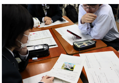
【わたしのストーリー】 私の「大切なもの」で振り返る