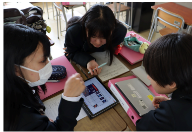
NASAゲームでチームビルド