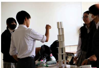
ペーパータワーでチームビルド