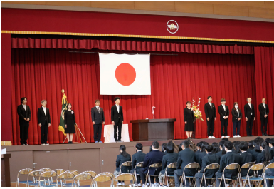
一年生の先生たちからご挨拶