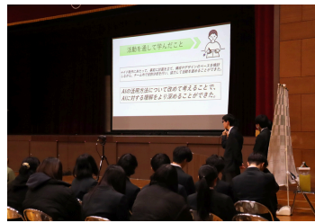
AIプロジェクト ~AIコンサルタントLEGAL&LIFE~