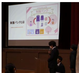
シェアエコプロジェクト ～学校SDG's制服バンク～