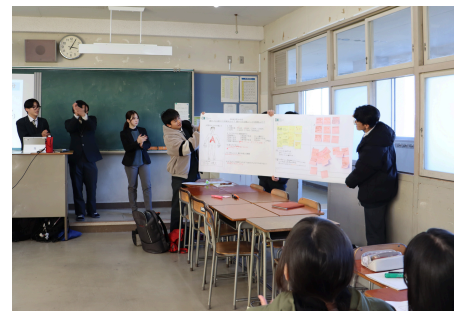
各グループによる発表の様子