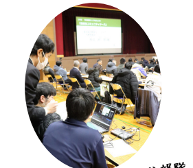
有志の生配信部隊