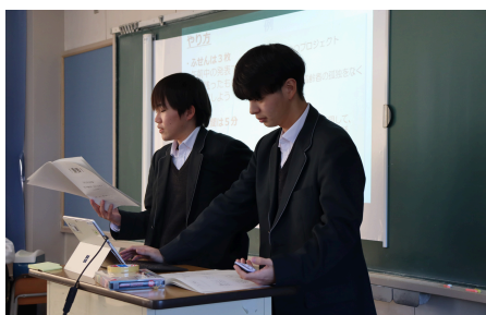
地探IIの生徒による司会進行