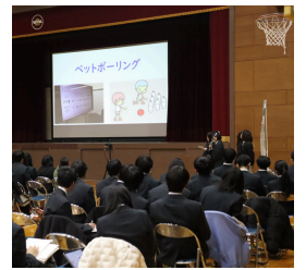
共生社会プロジェクト ~共生レクリ~