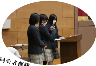
有志の司会者部隊