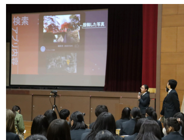
デジタルプロジェクト ～犬山四季彩～