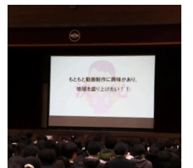
CMプロジェクト ~No name~