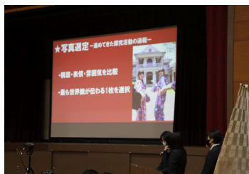
ポスタープロジェクト ~MEIJI Re:Walk~