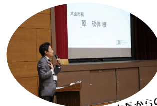
犬山市長からの ご講評

午前中の後半は、1年生の代表グループが体育館で発表を行いました。事前に行われた選考会で選ばれた生徒たちが、市長をはじめ来賓や全校生徒の前で成果を披露しました。犬山市役所の方々から講評もいただき、貴重な学びの時間となりました。