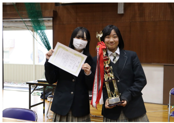
起業プロジェクト~カプセル工芸品~