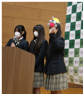
防災プロジェクト ～サイ防's～