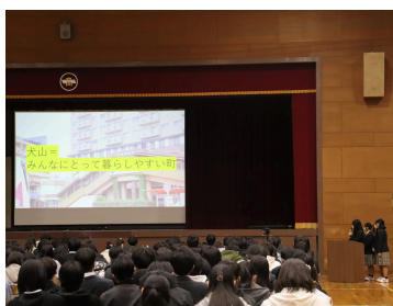
犬山PRプロジェクト ～犬山と世界を紡ぐ～