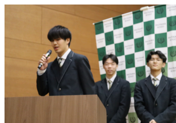
シェアエコプロジェクト ~sprints~