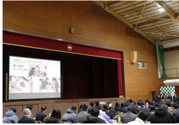
コミュニティナースプロジェクト ~グルル団~