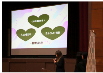
介護プロジェクト ~ファッションショー~