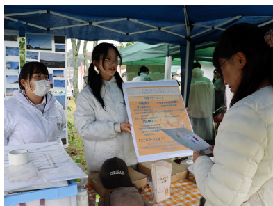
ヘルメットかぶる♪研究

先月に引き続き、各自のプロジェクト実現に向けた活動が次々と進んでいます。主体的に取り組む姿から、探究の深まりが感じられます♪