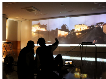
お出かけ大作戦 ～プロジェクトマッピングで台湾旅行～