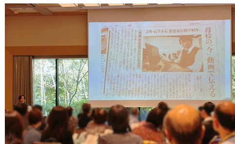
犬総PR動画作成プロジェクト

犬山南高校卒業生による同窓会総会からの依頼を受け 犬山総合高校の活動紹介動画を作成し、総会にて披露いたしました。