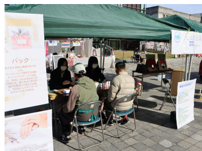
フレグランスハンドマッサージ ご協力元：POLAエスティンmonaさん