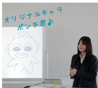
認知症予防！絵描き歌で脳トレ プロジェクト in 桑田ふれあいセンター