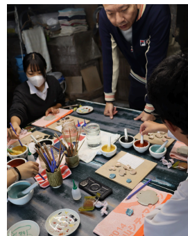
ご協力元： 犬山焼窯元後藤陶逸陶苑