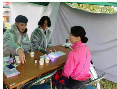
レジンキーホルダー作成 in 犬山マルシェ