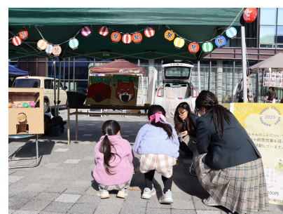
保護犬支援チャリティ ～手作りゲーム＆ガチャガチャで遊ぼう～

Happy Choiceさん主催 チャリティマルシェ2025 ～犬と猫と人のために～出展