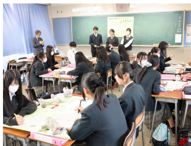
ライフジャケット作成について