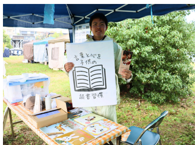
子どもの読書習慣推奨プロジェクト ～言葉と心を～

犬山南高校卒業生による同窓会総会からの依頼を受け 犬山総合高校の活動紹介動画を作成し、総会にて披露いたしました。