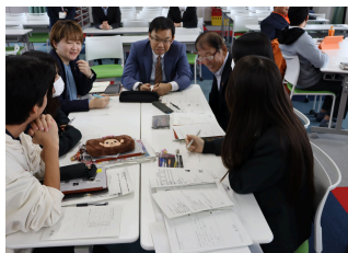
市議会議員の方々との意見交換会