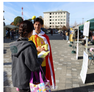
レモンの魅力を伝えるプロジェクト