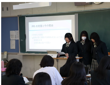
犬山市のPRについて