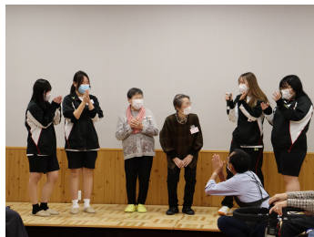
ファッションショー