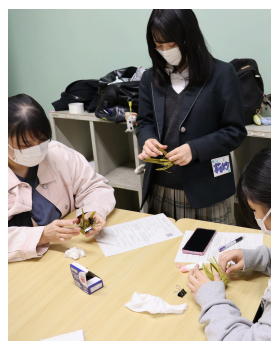
竹細工 in 学校説明会