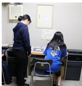
ジェネレーションMIX音楽ラジオ in 学校説明会