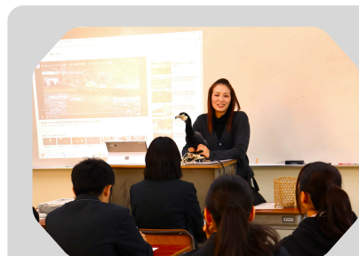
コミュニティビジネス☆鵜飼い