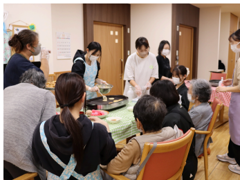
ほっこりおやつカフェ

いつもお世話になっている“特別養護老人ホームぬく森”さん。今回も4つのグループが活動させていただきました！