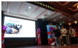
台湾華語での学校紹介

修学旅行委員が台湾華語で犬総の学校を紹介し、クイズなどを交えて交流しました。観光地の訪問や夜市での買い物を通じて、台湾文化に触れる貴重な体験となりました。