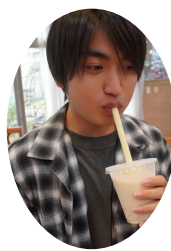
ドリンク作り体験

修学旅行委員が台湾華語で犬総の学校を紹介し、クイズなどを交えて交流しました。観光地の訪問や夜市での買い物を通じて、台湾文化に触れる貴重な体験となりました。