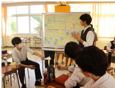
城下町人力車活性化プロジェクト ☆ ひかナイト

犬山市観光協会と連携したプロジェクトが進行中。 10月28日付 中日新聞近郊版に掲載されました。 11月15日から一週間放送予定です。