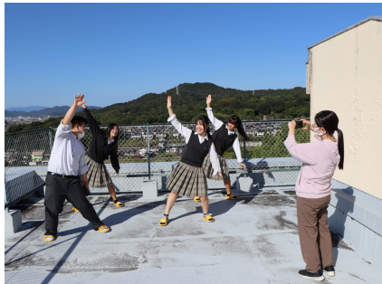
介護プロジェクト ☆ ダンスでENJOY屋上撮影