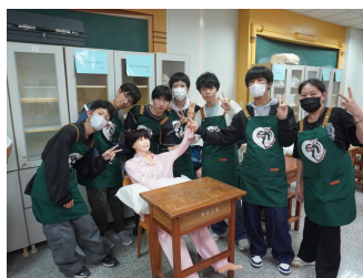
介護スタッフ体験

3泊4日の台湾旅行に無事に行ってきました！2日目のB&S（Brother&Sister）プログラムで現地の日本語を勉強している大学生たちとの交流を楽しんだり、3日目には喬治高級工商職業学校との交流や授業体験をして学びました。