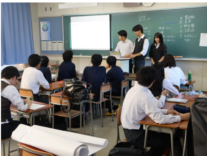
起業プロジェクト

先月に引き続き、それぞれの班別計画書に基づいてプロジェクトを進めています。各自の計画書に沿って、準備から実行へステップアップ！