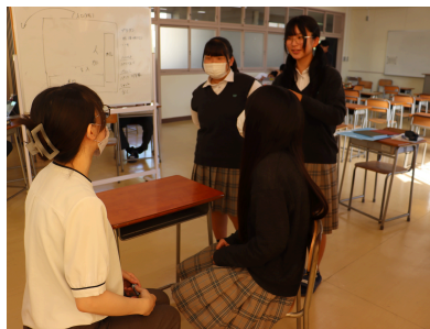
犬山ミュージック&アート フェスティバル2025 出店準備