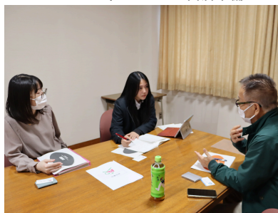
校内セラビードック体験打合せ