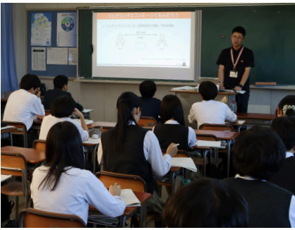
シェアエコについて