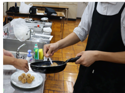
JA愛知北地産地消料理コンテスト応募