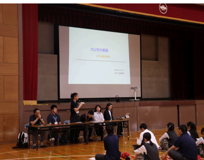
犬山市役所の方々からのお話