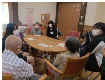
介護プロジェクト＊ 養護老人ホームぬく森さん