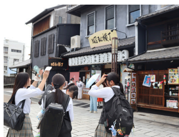
まちづくりと観光＊JTB