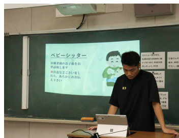
シェアエコプロジェクト