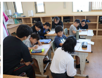
共生社会＊NPOシェイクハンス