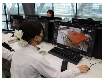
デザイン＊名古屋国際工科専門職大学

事前に1回ずつの学習に取り組んだ後、3日間にわたり、11テーマ・13か所の学校や事業所（敬称略）で分野別体験・見学を行いました。