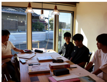
まちづくり×ビジネス＊成正建装