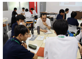
ソーシャルビジネス講座 講師：ボーダレスジャパン