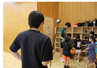
犬総活動紹介VTR撮影