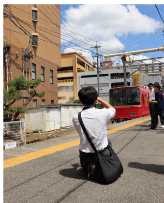
ポスタープロジェクト

それぞれのグループの計画書に基づいて早速地域へ出向きプロジェクトの第一歩を実践しはじめています