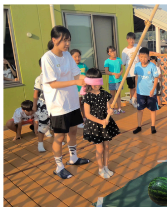
コミナスプロジェクト 地域のこどもたちとの交流