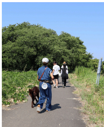
保護犬おさんぽボランティア