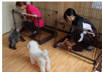
ドッグセラピー犬のお世話体験