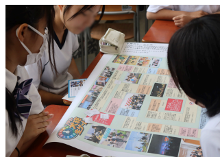
学校見学会 ワークショップ