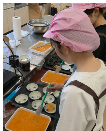
コミナスプロジェクト こども食堂のお手伝い