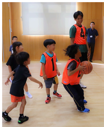
バスケットをしよう！ in楽田児童センター