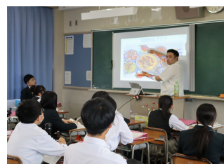
名経大留学生さん ワークショップ